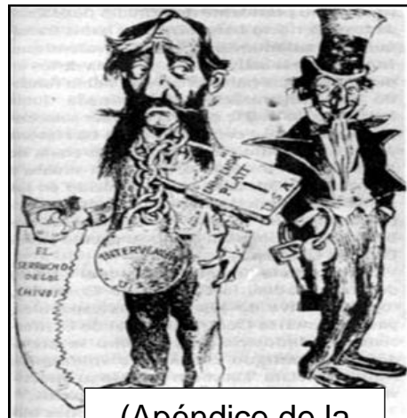
(Apéndice de la Constitución de 1901)