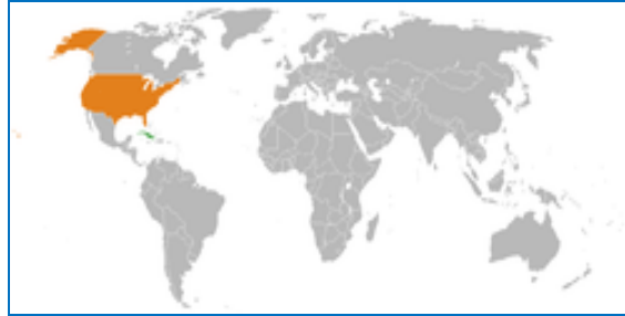
Cuba- Estados Unidos