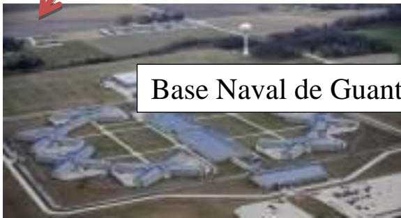
Base Naval de Guantánamo