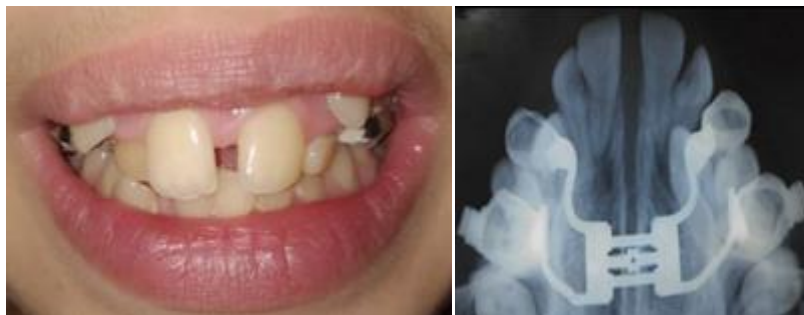
Figura No. 6 Día 9 Disyunción lograda.

triangular con la base hacia los espacios interincisivos, el vértice hacia la espina nasal posterior.