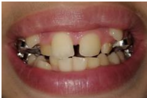
Figura No. 5 Día 4 aparición del diastema interincisivo.

A los cuatro días fue observado el diastema central. La disyunción fue lograda en su totalidad en un período de nueve días, generando 6.3 mm a nivel de primeros premolares; 7 mm a nivel de segundos premolares y molares.