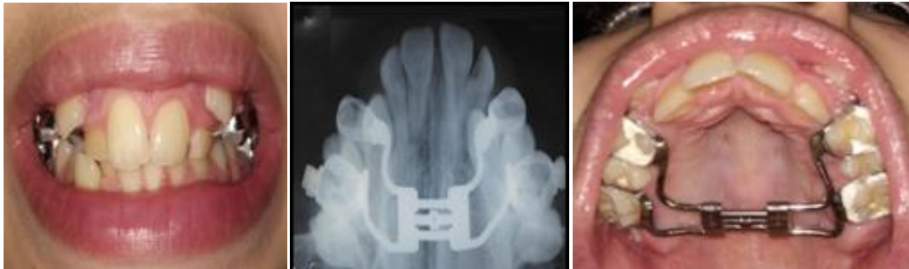
Figura No. 4 Momento de de la instalación del aparato, Día 1.

la activación, la que se realizó dándole \frac{3}{4} de vuelta al Tornillo (el equivalente a 0.75 mm diarios) momento en que apareció la sintomatología en la paciente; se les explicó tanto a la paciente como a la madre todo lo referente al funcionamiento de este aparato, posibles complicaciones y sintomatología debido a que las siguientes activaciones diarias se harán en la casa aplicando \frac{3}{4} de vueltas diarias durante nueve días.